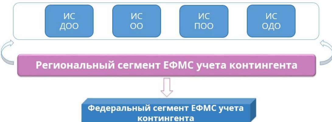
Схема обмена данными